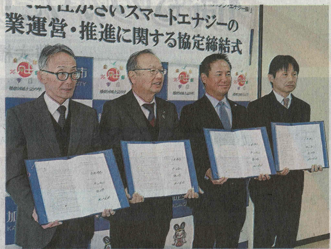
加西市や企業の代表者らが出席した協定締結式 ＝加西市役所

加西市などが出資する地域エネルギー会社「かさいスマートエナジー」は、加西市と車載用電池メーカー「プライムプラネットエナジー&ソリューションズ」(PPEs、関西本社・同市)、小売電気事業者「シン・エナジー」(神戸市)の3者と事業協定を締結した。蓄電池を活用した電力の自家消費率向上を目指し協力する。 2022年、加西市とPPEsの共同提案が環境省に認められ、同市は脱炭素